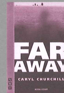
「前進進戲劇工作坊」《遠方》(Far Away)排練照