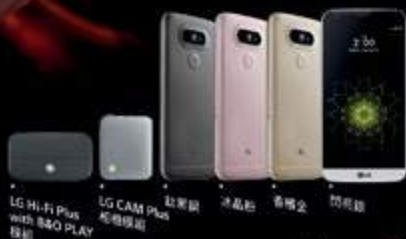
LG Hi-Fi Plus with S&O PLAY 揚聲器