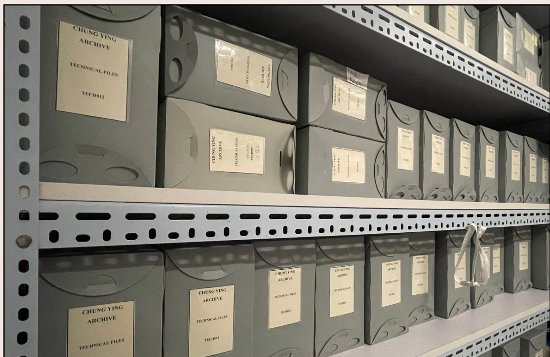
中英檔案文獻庫

保存不單是隨劇團發展而有意義，更是隨著社會科技發展。紀錄技術發展上，會因為時代轉變而要去調整，去繼續保存工作。胡家欣舉例以前攝影師是用DVD傳相，現在就只是提供一條下載網址。又例如現在演出都是4K的毛片，影片檔案很大，結果硬碟也愈買愈多。進劇場用了一年把所有VHS存入電腦，不斷轉檔，把不同檔案好好整理存檔，才能容易處理。即使沒有資助，都會把拍照拍片等紀錄加在製作費預算中。紀錄是一個基礎，陳麗珠會保存她自己創作上的劇本，因為她自己記下很多筆記及功課在其中，所以紀錄是會一直影響其他創作的發展，雖然進劇場演出感覺很分散，但其實環環相扣，會在計劃演出時回顧過往的製作，或以前觀眾的意見紀錄，從而了解發展方向有甚麼需要調整的地方。