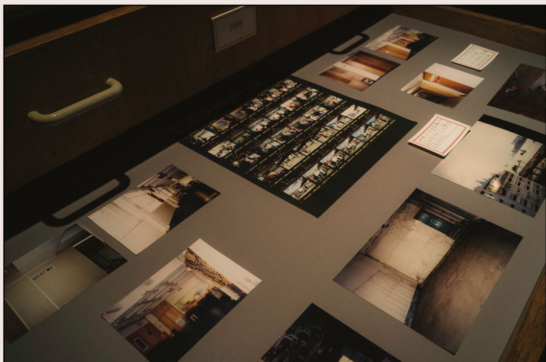
前進二十年，四季花開「劇季·春」：二十周年文件展

有以前的文件、相片、製作相關的回憶或實物都搜索出來。另外還為了海報展覽，將二十年來的宣傳資料重看一次再作挑選，將海報數碼化及列印展出。及後前進進獲得資助把歷年場刊數碼化放上ISSUU，整理過後置放在前進進的新網頁，公眾可經網頁去閱覽過去二十年演出的場刊。網頁還設有特別的專頁，儘量把與製作有關或前進進的媒體報導及評論放上網頁。除了網頁，前進進還有一個YouTube頻道，展示過往演出的精華片段及選段節錄，而完整的演出則沒有放上網。