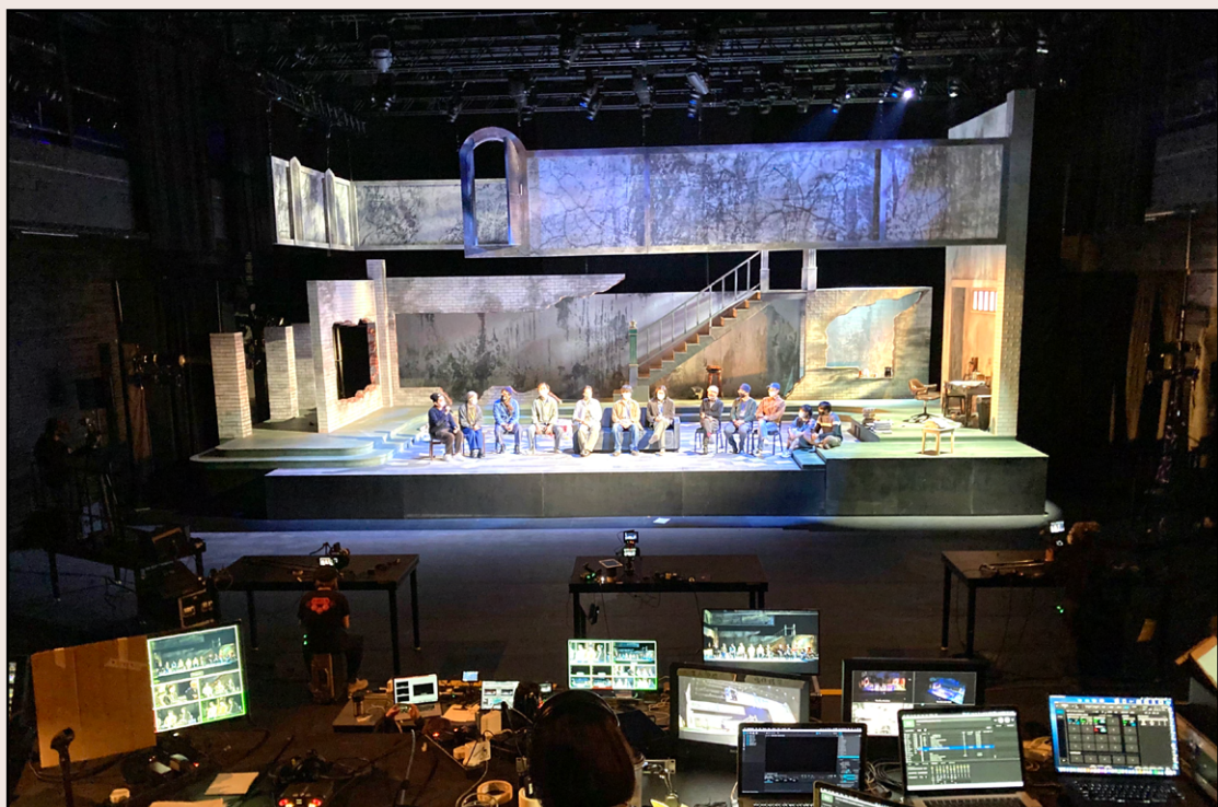
《午睡》（2021）直播現場

事實上，由於預視於大盒實體演出的機會渺茫，Olivia形容一切部署皆為轉直播而準備，「我要知道幾多人肯轉online場次，當監製決定跟西九deal做online場次時，已有數據在手，數據話我知如果轉online場次，有一半人肯，我就預計大盒場次大概都是這麼多。」