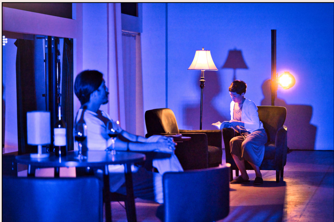
「大館舞台」節目之一：《有你，故我在》（進行中）— 在下世紀來臨前嬉戲（2020）— 攝影：YC Kwan 照片鳴謝：再構造劇場、Felixism Creation

「大館舞台」由「大館表演藝術季：SPOTLIGHT」的延伸網上作品，加上馬會額外資助的階段展演（work-in-progress）所組成。由二〇二〇年九月開始，定期於網上平台發佈節目，頻率大概每個月兩至四個節目，至翌年年中仍然持續上架。Eddy表示：「整個『大館舞台』差不多二十個programmes，總共四十幾萬views。」成績驕人，Eddy認為除了多得藝術家的創意，亦因為另一個設計：「我們的片通常是十五分鐘，是很重要的元素，太長不行的。」時間上的原則，呼應大館現場演出維持於一小時左右的策略，「我們參考了Fringe（藝穗節）的模式，把演出時間控制得比較適中……（所以）跟artists傾過，不需要太長，這不是拍電影。」貼近觀眾疫下生活的狀態，Frieda認為也是反應理想的原因之一，亦有助開拓新觀眾，「因為內容貼地，所以reach到很多素人，而非一直以來的arts lover觀眾。」