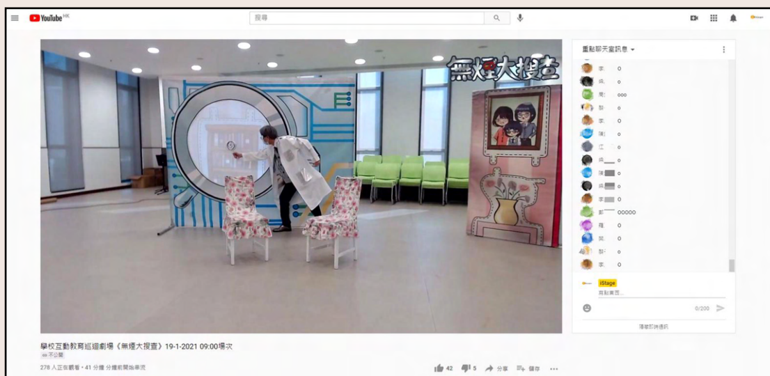
iStage運用YouTube live的即時留言功能，與學生互動 一照片鳴謝：iStage

線上直播巡迴劇實際執行後，亦面對不少實務問題，其中一個最明顯的是，當多間學校同樣選擇同一個演期日子及時間，直播空間問題如何解決？Mathew稱：「排練室得一個，我哪有地方？就要租地方，但政府場地全封，唯有左借右問。」Elton和Mathew形容這段期間得到業界的慷慨相助，甚至願意免費借出場地，才能解決難題。「因為幾個巡迴劇都在追場數，所以不想放過任何場數，即使蝕些租金，都希望做到那場。」除了空間，器材亦無法在相撞的劇目裡共用，亦為劇團帶來額外開支。