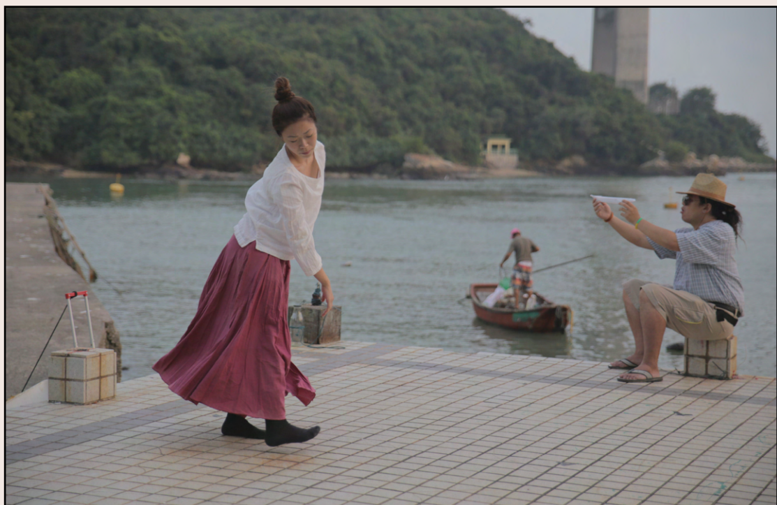
《七天七夜——一缺（魔幻日常的）城市誦曲》（2015）— 照片鳴謝：小息跨媒介創作室

然而創作完成後，是否就代表這種個人經驗就戛然而止？畢竟在文化恍似變得民主化的年代，我們都已聽慣「作者已死」的論述，彷彿作品生成後，便會自然掙脫那條連繫作者和作品之間的臍帶，擁有其自身的生命。然而作品出走以後，又會以何種姿態呈現及重現？如果說作品盛載的是作者生活經驗之沉澱，而不只是某種因為必須滿足（當權者或抗爭者的）政治正確需要而應運而生的「問題劇」，那麼這種生活經驗又如何能在其漂流於時間之際呈現自身？幾位編劇對重演舊作的取態大概能說明一二。