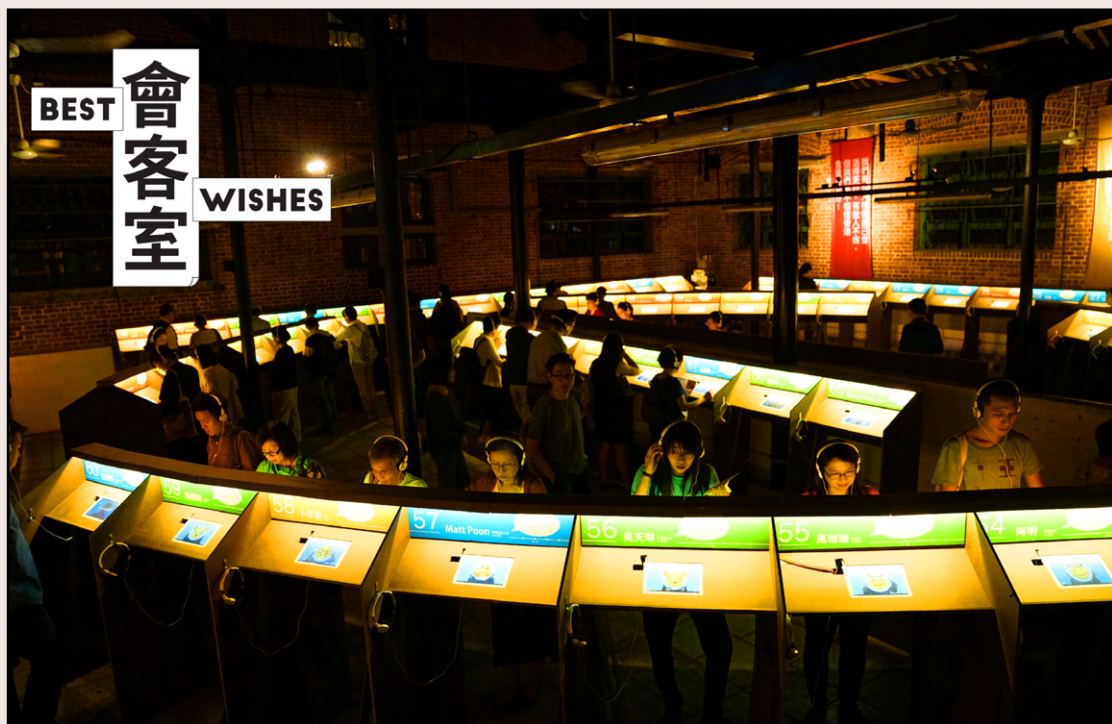
《會客室》（2018）