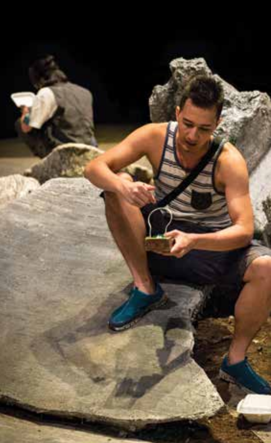
《人間煙火》 火腿在我心中留下的痕跡