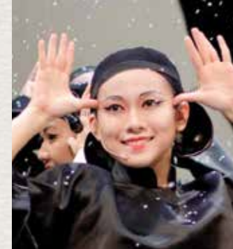
▼ 《秀才與劊子手》 木偶