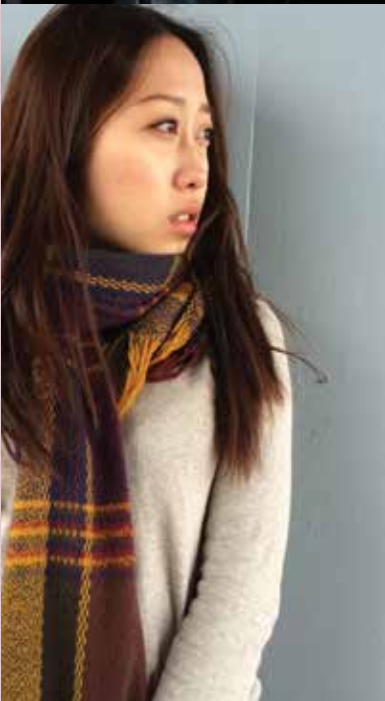
我喜歡遠望的感覺。