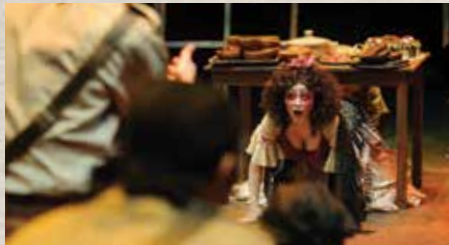
《Ubu》Ubu媽：唉呀，一唔小心就倒瀉囉！