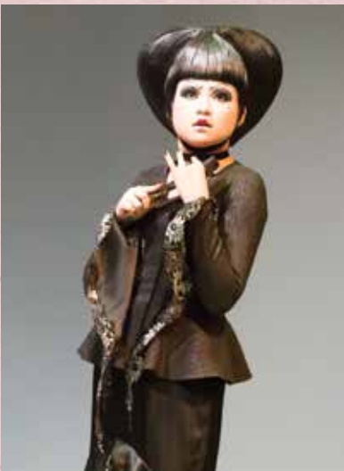
《造謠學堂》恭心計校長