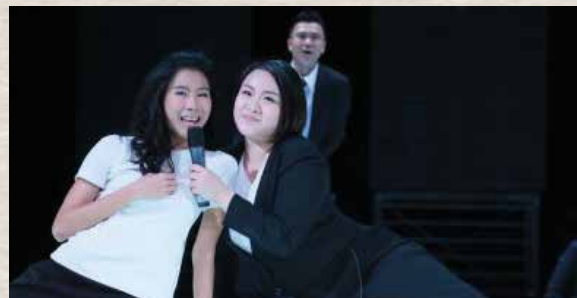
《電子城市》城市人、歌唱者