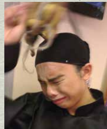
最後一場《秀才與劊子手》 要交還面具，極不捨得