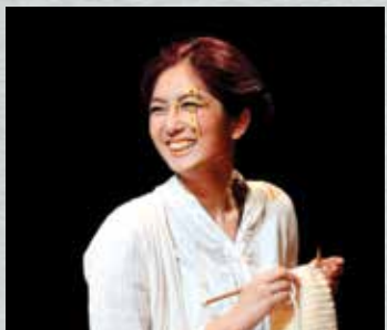
▶ 我一直相信有一位天使守護住我 而且不斷向我提示這個世界的善良和美好