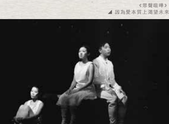
《眾聲喧嘩》 ▲ 因為愛本質上渴望未來