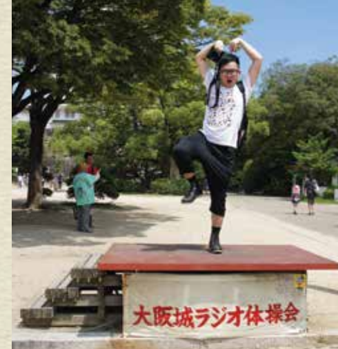
一入體操會 身體就忍不住動起來