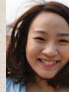
「向後走是為了向前行得更遠」