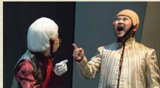
《造謠學堂》金必多：快樂就是這麼簡單