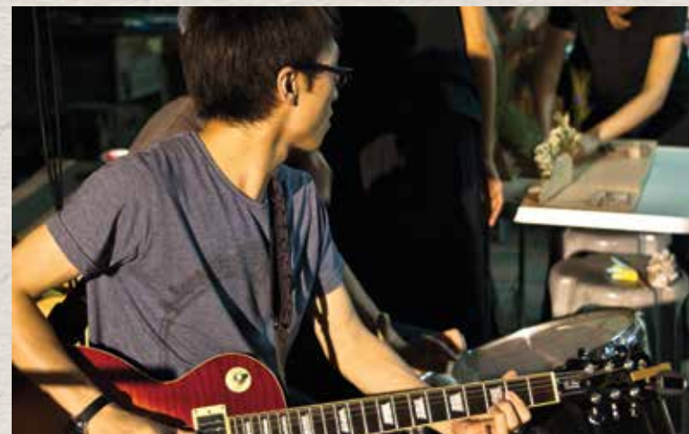
▲ 《尋找快樂村》 坪輦 將村民的故事帶回給村民