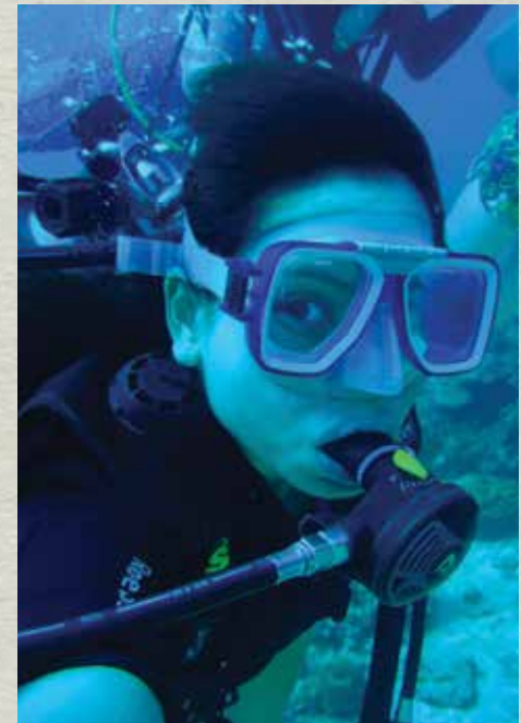
▲ 在安靜的大海裡，我看見了海龜 它在我身邊，靜靜的經過