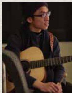
▲ 《尋找快樂村》 城大東北藝術展