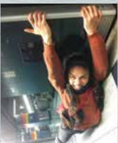
► It's Falling.....