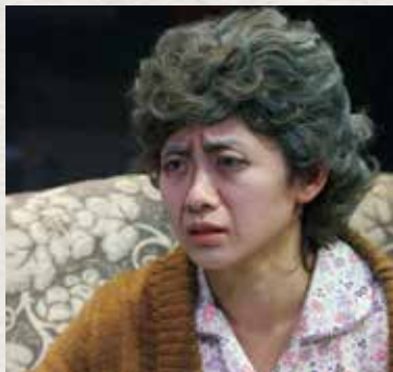
▼ 《晚安，媽媽》 我老喇，唔講得笑架！