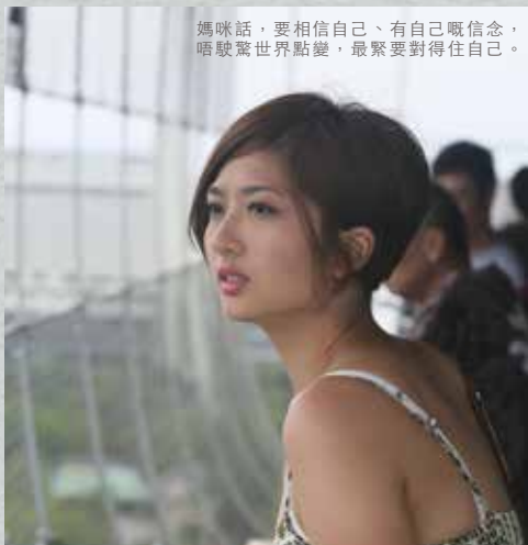
媽咪話，要相信自己、有自己嘅信念， 唔駛驚世界點變，最緊要對得住自己。