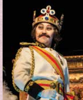
《UBU》 波蘭國王：「似林子祥有咩問題呀?!」