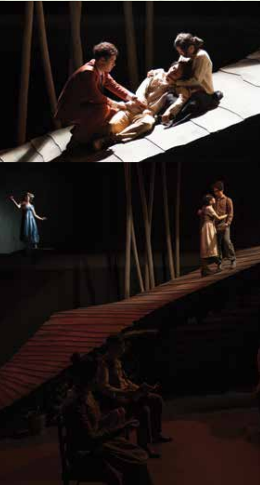
2014 / 3 香港演藝學院《天邊外》（擔任導演） ▼天邊還是這麼遙遠這麼迷人