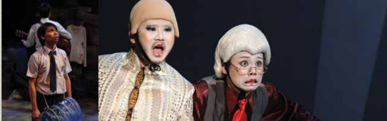
◀ 彷彿在沙丘上跳舞》 曠豬