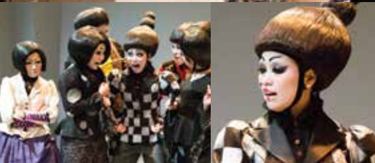
《造謠學堂》大姨媽愛生事 ▼