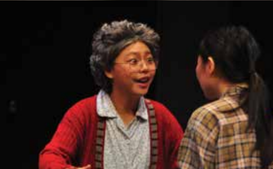
▼《晚安，媽媽》劇照 Thelma：其實有一個咁可愛嘅媽媽，你應該開心架！