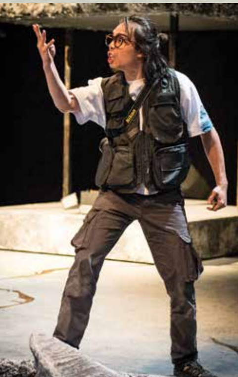
◀ 無常 《人間煙火》