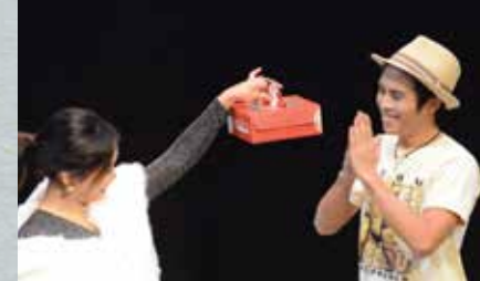
《白色極樂商場漫遊》 CAFE仔