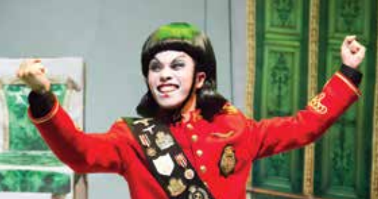
《造謠學堂》金正仁：造謠學堂果然做到呀！▼