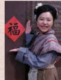
▼農婦：中國女人的代表， 恭喜發財呀！