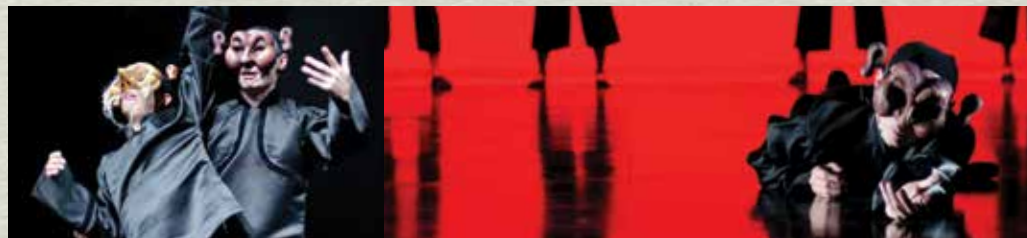
▲《秀才與劊子手》木偶 死刑就是我們的結局