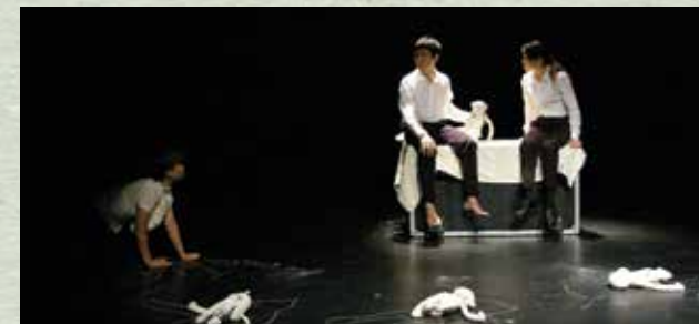
2011-8 香港話劇團外展教室 《面壁》（擔任導演） 在夢境與現實之間