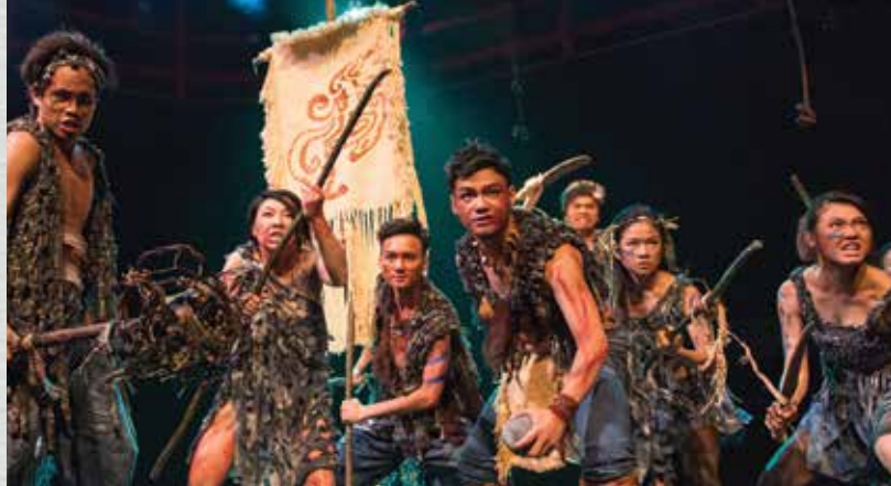
▶ 《羊泉鄉》 北門