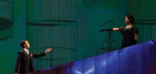
▼ 《馴悍記》 Bianca