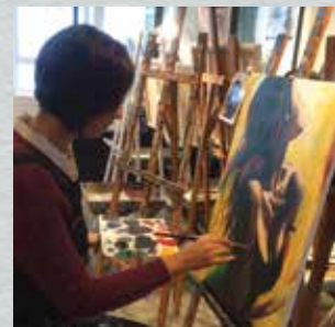
▶ 在這速食都市中，我們被迫忘記了專注及堅持所帶來的幸福 那比新鮮刺激更實在、更長久的快樂