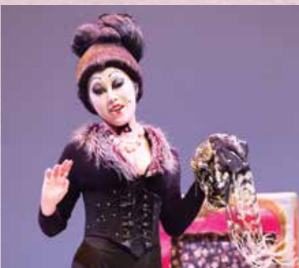
《造謠學堂》錢夫人 一場令你心跳加速的比賽