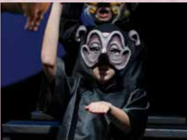
《秀才與劊子手》肉見真章，有多強便較量。