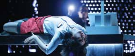
▶ 《電子城市》 Joy「呢啲就係我對自己生命嘅記憶，一片數字嘅海洋」