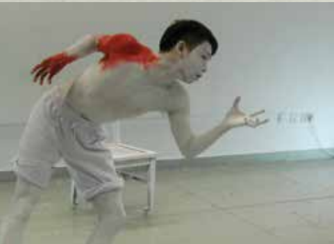
► 《流浪狗》 實驗形體