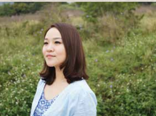
▲ 所謂伊人在水一方