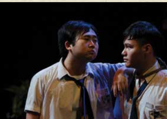
《彷彿在沙丘上跳舞》 傻強：唔洗驚嗰，嗰學校有我照你!