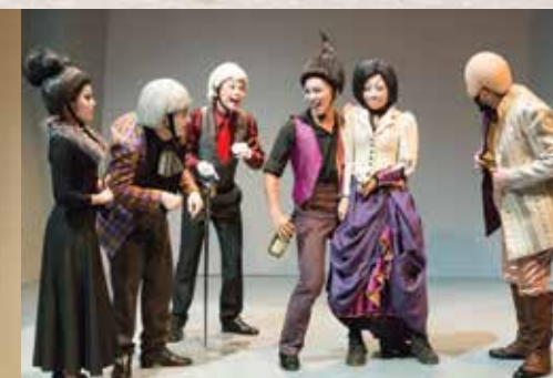
▶《造謠學堂》不羈風流