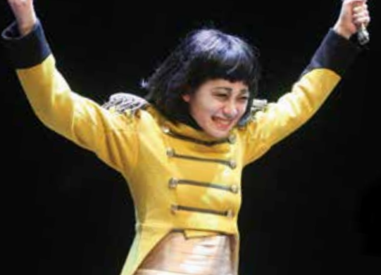
▶ 《Ubu》 朋友！我哋勝利喇！