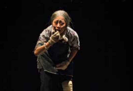
《人間煙火》老婦 老婦：「可以的話，不要放棄。」