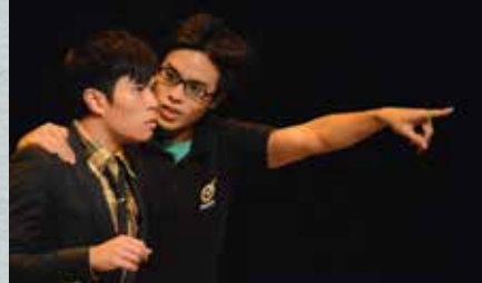
《白色極樂商場漫遊》 男Sales