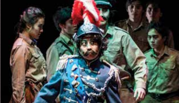
《UBU》沙皇「別人笑我太瘋癲，我笑他人看不穿。」