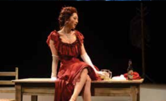
▶ 據說梅麗·史翠普的畢業作，也是Miss Julie