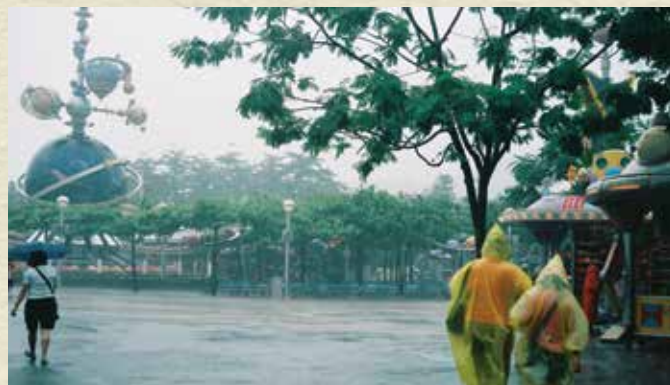
攝影作品 悲傷的氣氛籠罩著開心的地方