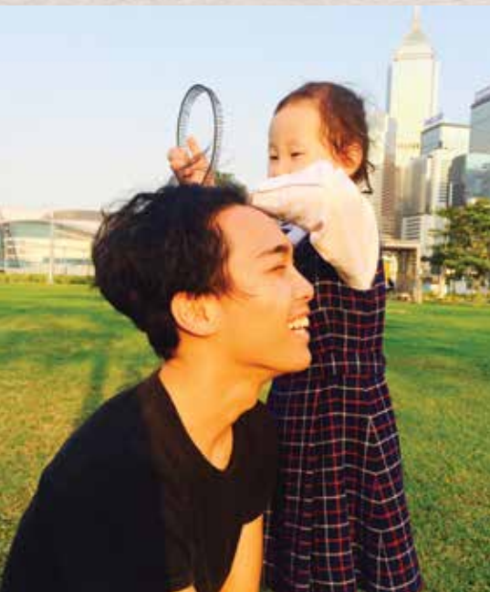
Truth lies within ▶