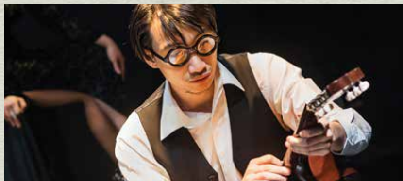
▼《馴悍記》Hortensio 花園裡的情人