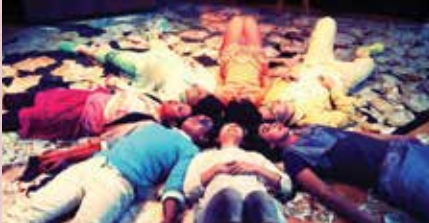
在大悲與大喜之間，在歡笑與流淚之後 我體會到前所未有的痛苦和幸福