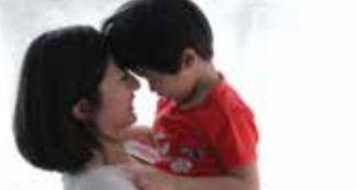
▶ 3M微電影 愛·無痕 - Command™無痕™魔術貼 微電影(媽媽的愛篇) - 媽媽