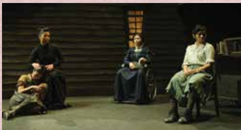
《天邊外》艾金斯太太