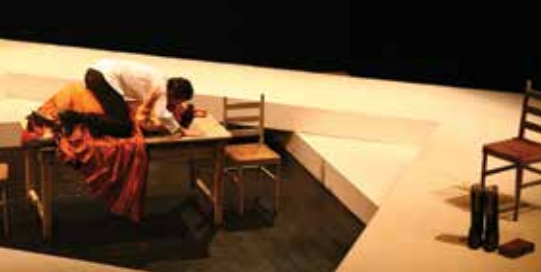
▲ 《朱莉小姐》（擔任導演） Jean and Kristine