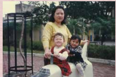
生活態度 - 招積