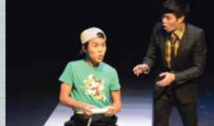
《白色極樂商場漫遊》 小朋友：是您讓我起飛