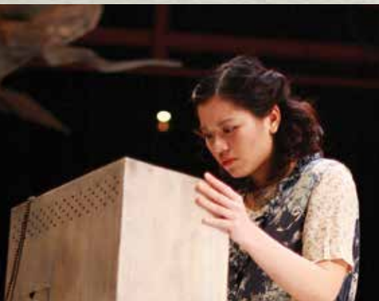
《豐收月起舞》