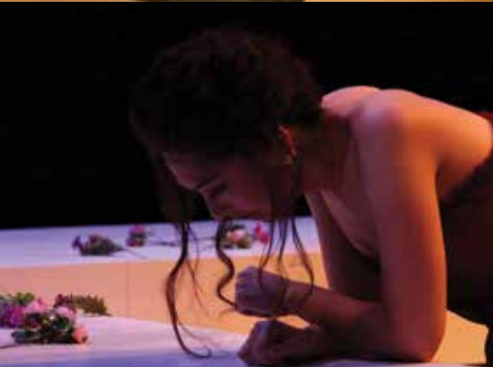
▲ 《朱莉小姐》（擔任導演） Julie & Flowers