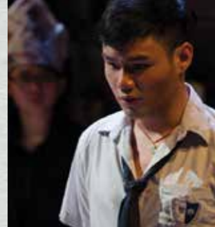
▶ 《彷彿在沙丘上跳舞》 喪B