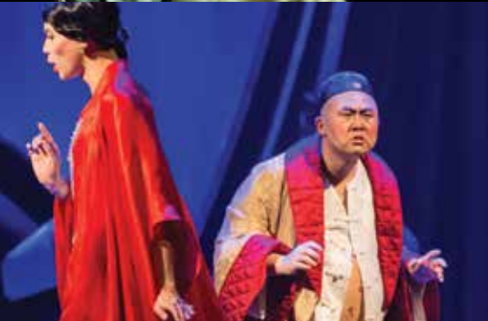
《馴悍記》(跨院製作) 忽然富貴 崑仁先