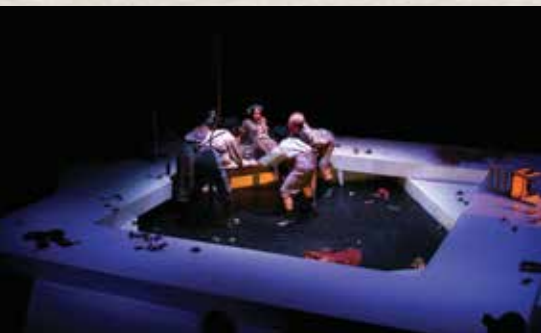
▲ 《朱莉小姐》（擔任導演） ▲ 農民