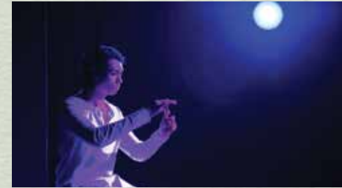
2010 / 7 前進進戲劇工作坊 《斷食少女·K》（擔任演員） 我抗爭我吶喊我年青