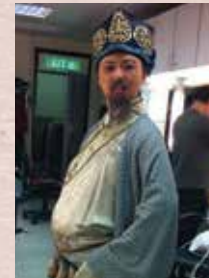
▼老財主：中國男人的代表 我要金我要金，哈哈哈哈哈