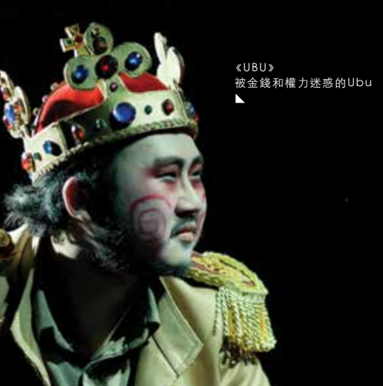
《UBU》 被金錢和權力迷惑的Ubu