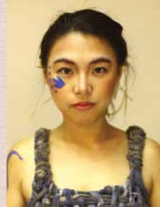
▼《羊泉鄉》造型照 牛屎妹：我也是個強大的女人！