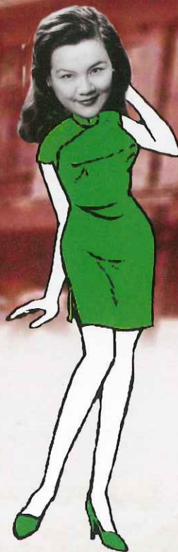
吳國基 - 肥華 記者 群衆 (演員)

曾經有朋友問我：「有什麼事情是你好後悔沒有做到？」我想立刻就答：「用神給我戲劇上的恩賜好好事奉主！」僕人按才幹領五千二千一千銀子的比喻亦不斷地提醒我不可再理起神賜予的“家業”。奕豬在劇內雖然未正式認識耶穌，但我相信神的愛一直沒有離開她，和我們每一個！