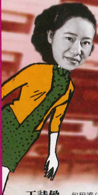
王詩敏 - 包租婆(B組) 阿麗(A組) 群衆 (道具助理 / 演員)