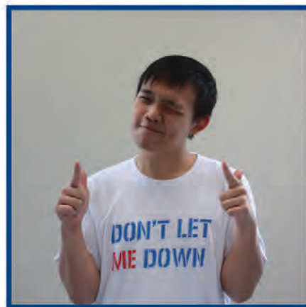
ASM - 輝