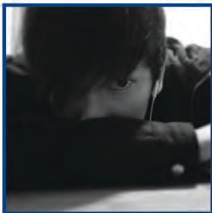
ASM - 惠

我的演出總在一角無聲色地完成，如果你明白，你一定是經歷過；如果你不明白，希望你仍然記得，一個為你做好舞台上的台、燈、聲效果的黑衣人。