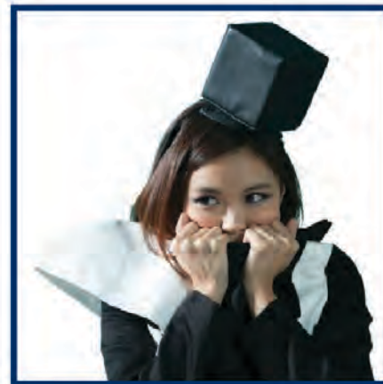
演員(Z) - SoSo