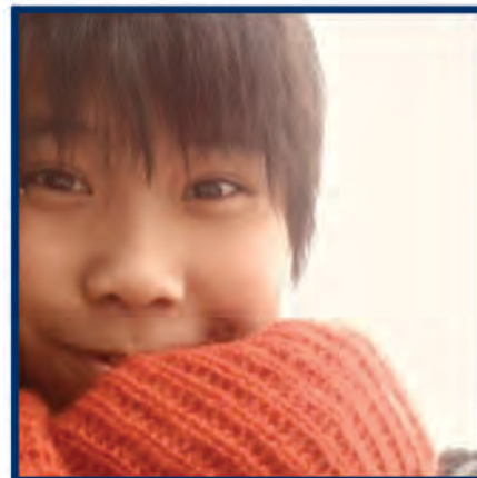
ASM - Iris

畢業於廣州暨南大學中文系戲劇影視文學專業。從中學時期起接觸話劇，因而改變了對生活的看法，認為「藝術是生活的一部分」。今次話劇《XYZ》是畢業後首部參與作品。