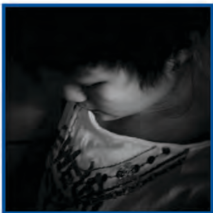
DSM - Cham