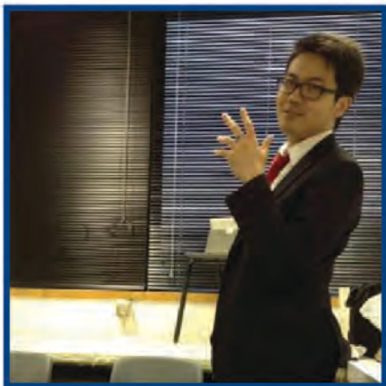
導演 - Ray