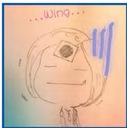
服裝設計 - Wing